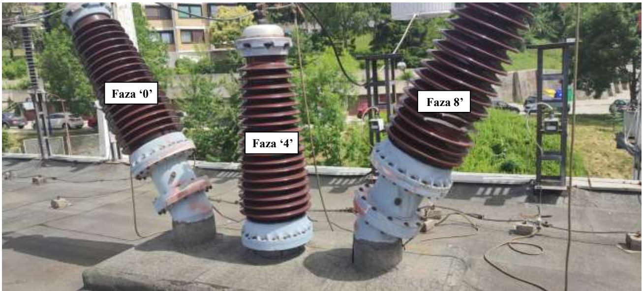
Slika 7. Polje DV 110 kV Pale - Provodni izolatori za priključak SF 6 postrojenja na dalekovod na krovu pogonske zgrade