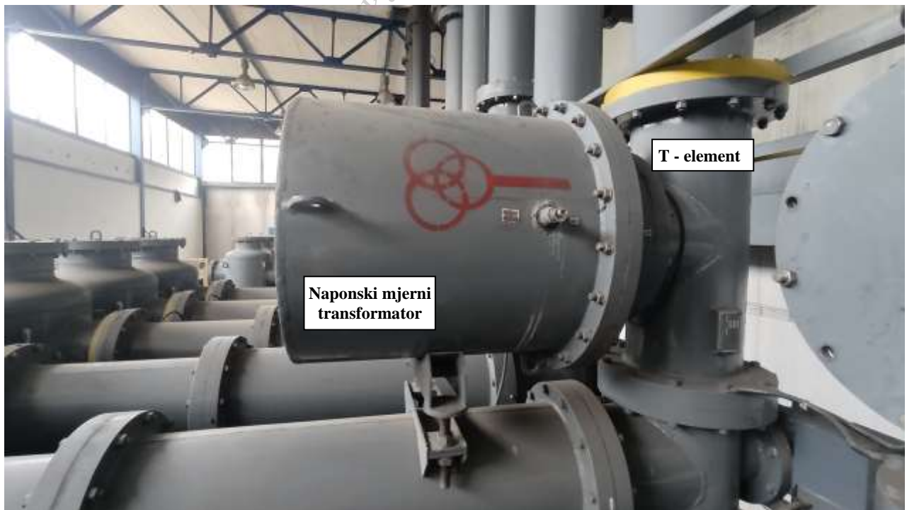
Slika 6. Polje DV 110 kV Pale - Induktivni naponski transformator u fazi 4, detalj ugradnje sa 'T' elementom