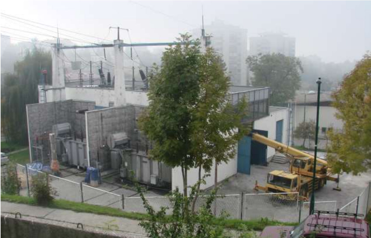
Slika 1. TS 110/10 kV Sarajevo 5 (Koševo)