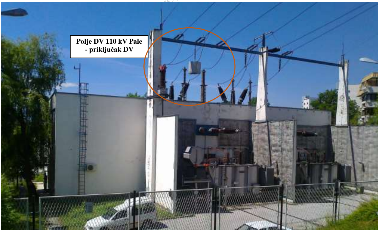
Slika 2. TS 110/10 kV Sarajevo 5 (Koševo) - priključak DV 110 kV Pale na postrojenje MOP 110 kV