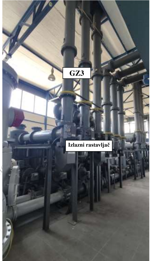
Slika 3. Polje DV 110 kV Pale - prednji izgled