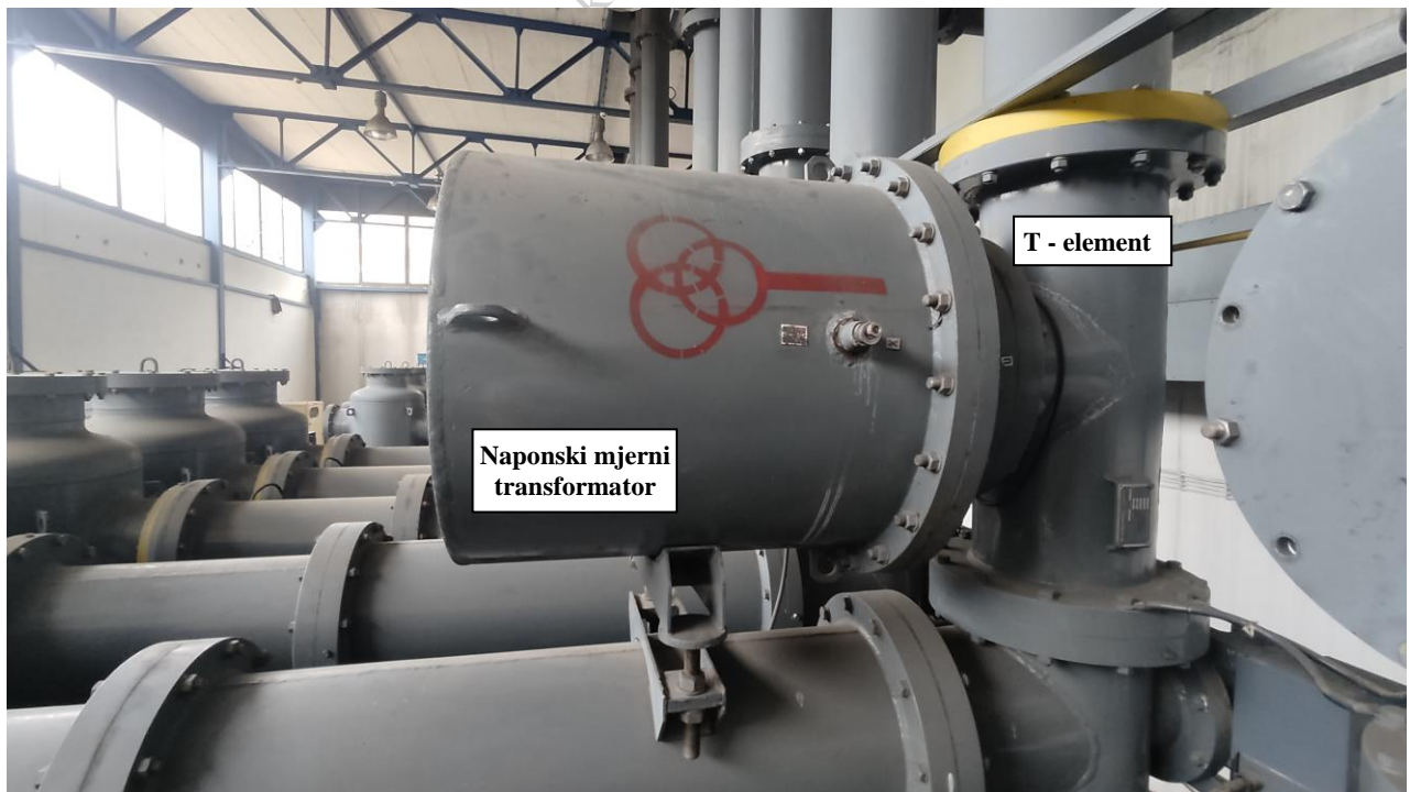
Slika 6. Polje DV 110 kV Pale - Induktivni naponski transformator u fazi 4, detalj ugradnje sa 'T' elementom