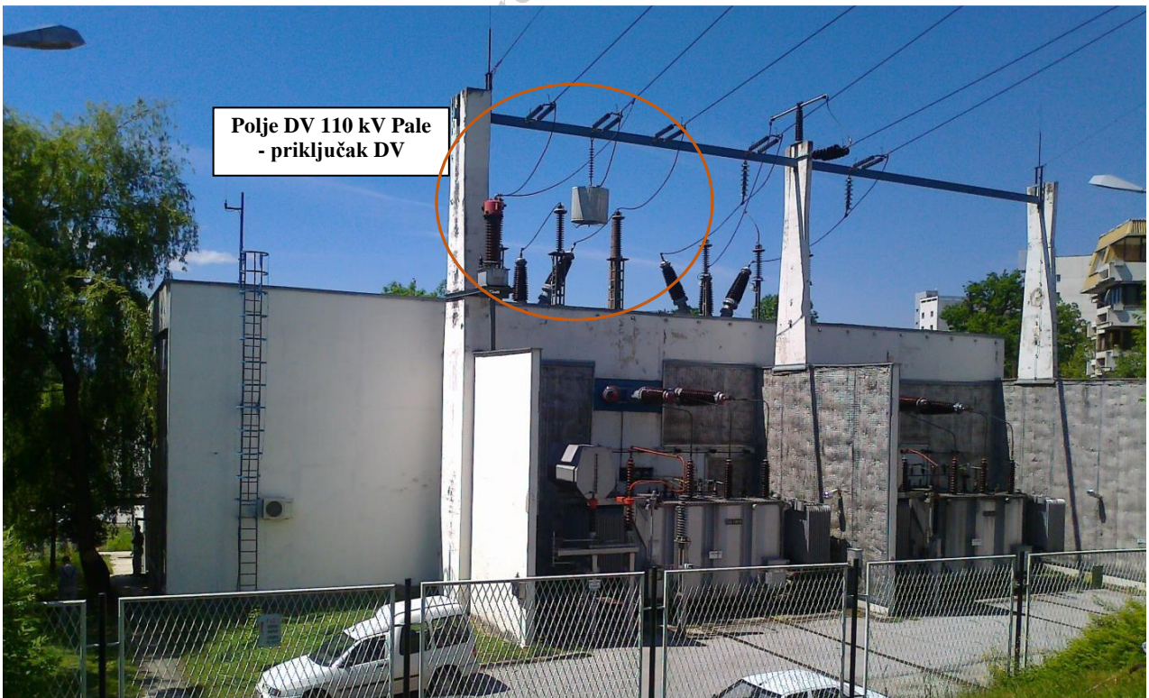
Slika 2. TS 110/10 kV Sarajevo 5 (Koševo) - priključak DV 110 kV Pale na postrojenje MOP 110 kV