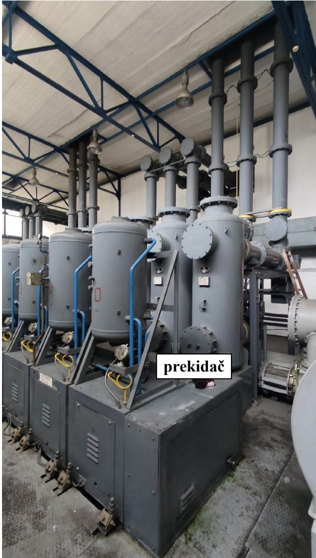
Slika 3. Polje DV 110 kV Pale - prednji izgled