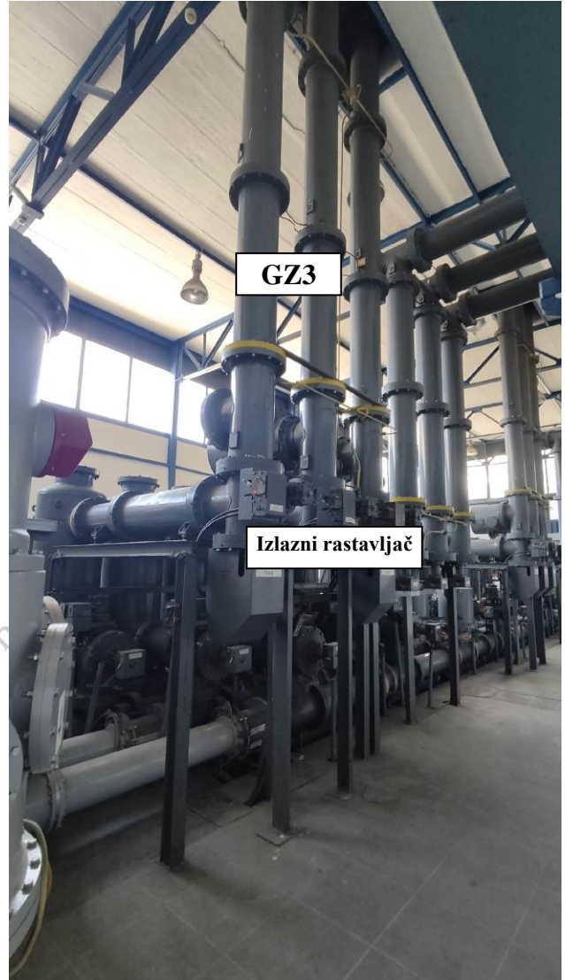
Slika 4. Polje DV 110 kV Pale - zadnji izgled