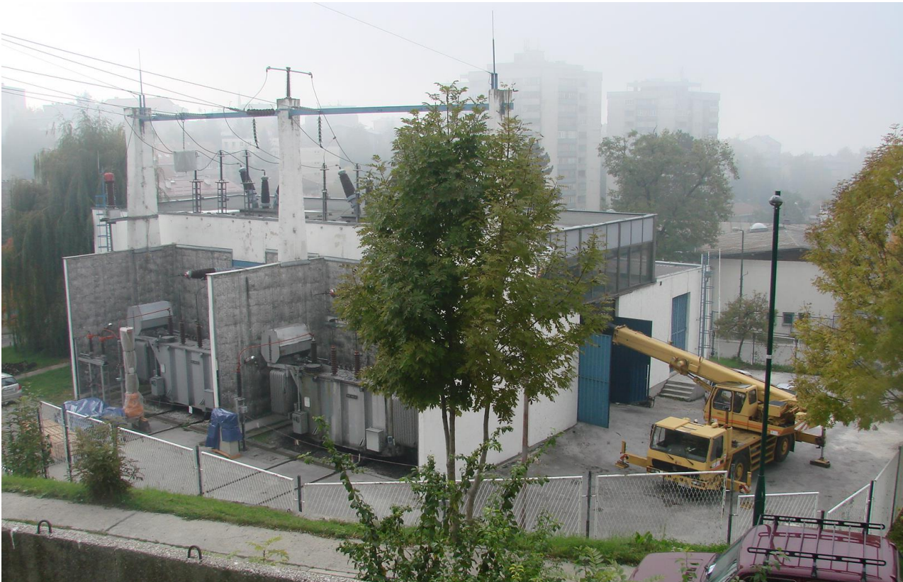
Slika 1. TS 110/10 kV Sarajevo 5 (Koševo)